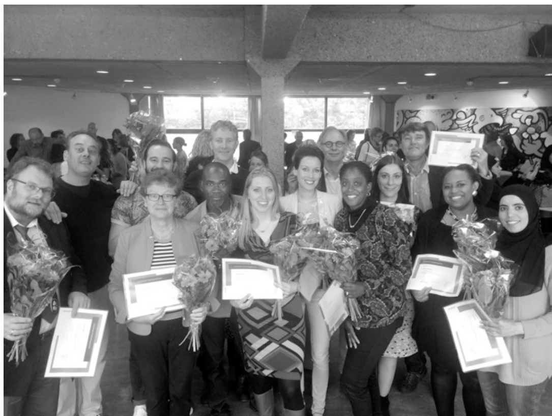
Figuur 3. Certificeringsbijeenkomst op 2 juni 2015 van 79 werkplekbegeleiders op het Rosa Beroeps College, Amsterdam.

De afsluiting van de cursussen en uitreikingen van de certificaten vindt centraal plaats op een opleidingsschool via een officiële en feestelijke certificeringsbijeenkomst in juni.